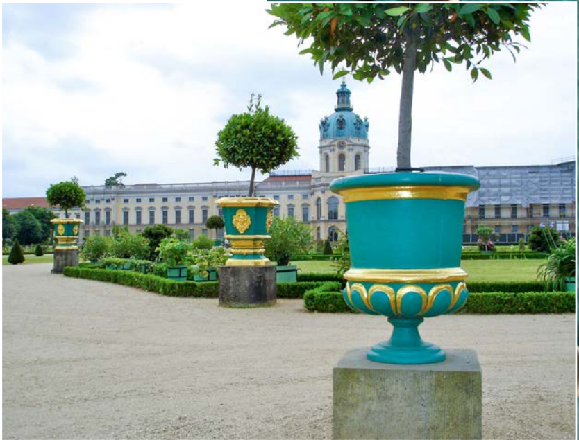
Fotos: Ralf Werner/Produktion: Andrea Sundermann (2), Thorsten Theel

Die Glocken- und Maskenvasen aus Eisenguss er- strahlen vor dem Charlottenburger Schloss in neuem Glanz. Bei solchen Aufträgen arbeitet der Handwerker mit einer Fassmalerin zusammen, die auch vergoldet